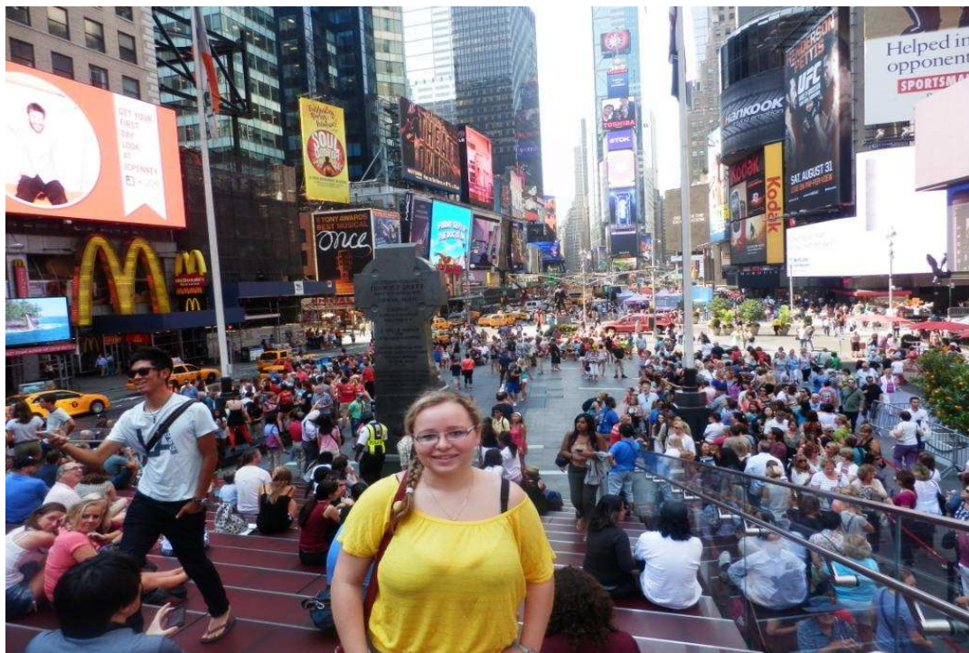
Times Square – New York

Každopádně stojí za to Ameriku navštívit a udělat si o ní vlastní obrázek. Manhattan skutečně stojí za to. Člověk pak úplně jinak kouká na to své prostředí, kde žije a zjišťuje, že ne vše je samozřejmost. Například na rozdíl od nás tam mají CocaColu levnější než vodu. U nás je zase pivo levnější než voda. A myslím, že je to tak lepší. Ameriku navštívit? Ano, ale držme se raději v Nerestcích, přátelé.